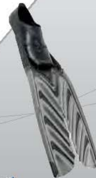
TWIN SPEED С Пантоф