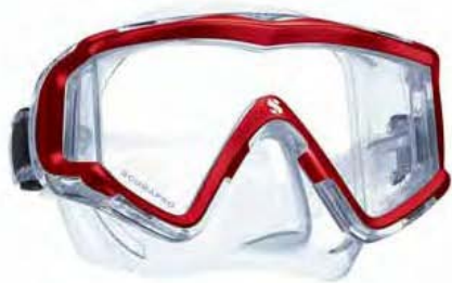
CRYSTAL VU METALLIC