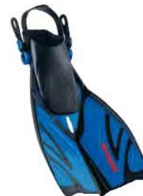
ШНОРХЕЛ ПРО за ВЪЗРАСТНИ – РЕГУЛИРУЕМ