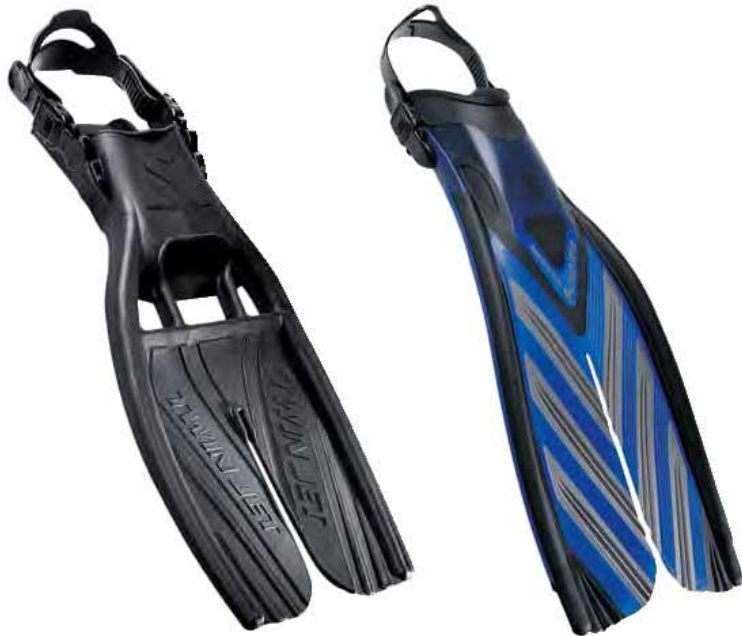
TWIN JET ADJUSTABLE