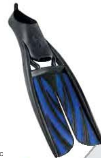
TWIN JET МАКС С Пантоф