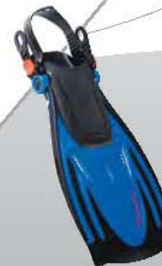
ШНОРХЕЛ ПРО Младешки – РЕГУЛИРУЕМ