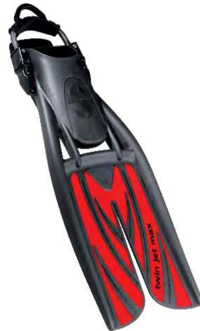
TWIN JET МАКС Регулируем