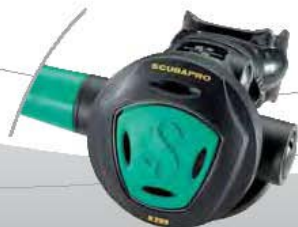
MK2 PLUS/R295 NITROX